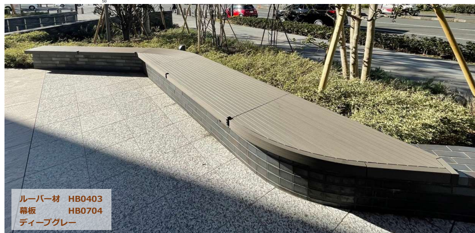
ルーバー材 HB0403 幕板 HB0704 ディーブグレー