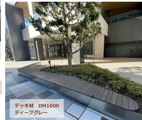
デッキ材 DM1000 ディーブグレー