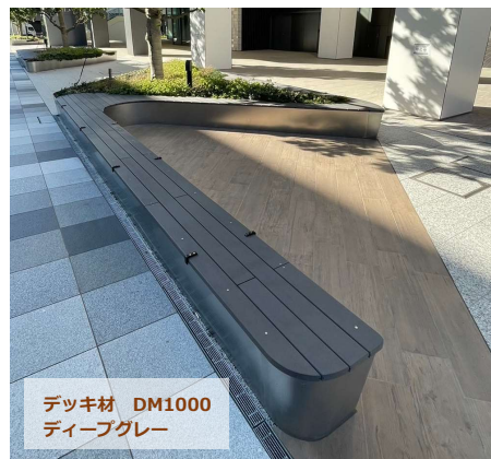
デッキ材 DM1000 ディーブグレー