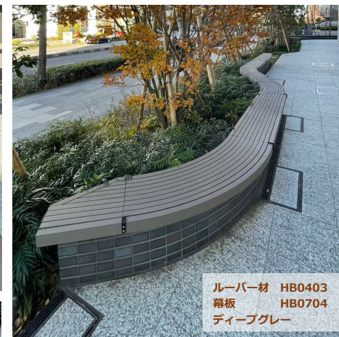
ルーバー材 HB0403 幕板 HB0704 ディーブグレー