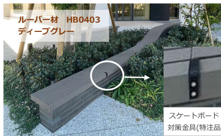
ルーバー材 HB0403 ディーブグレー