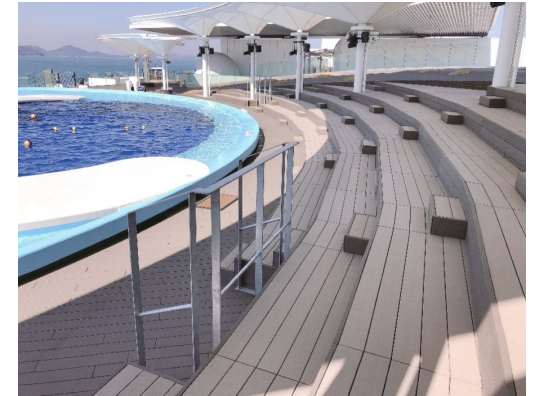
海辺水族館 イルカショープールの観客席