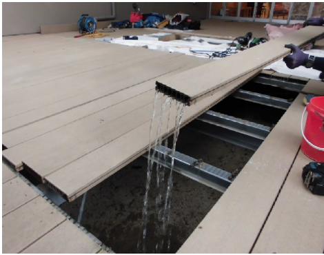
デッキ中空部に溜まった雨水

従来の再生木デッキ材は、長年屋外での使用による変形することが頻発しています。デッキ材が変形する一つの理由は配合されている木粉が吸水してしまい、定尺より伸びてしまいます。「床下の排水環境の悪化」、「雨水溜りや積雪・融雪」、「川や海等の水の多い場所や湿度の高い場所での設置」はデッキが変形しやすい要因になります。