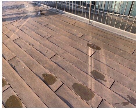
長年使用で変形したデッキ

これらの事から、エコロッカの再生木デッキ材【DK2020Vシリーズ】は特殊素材「Vフィラー」を配合することで、吸水による長さの変化率を従来品の約1/4に低減することができました。