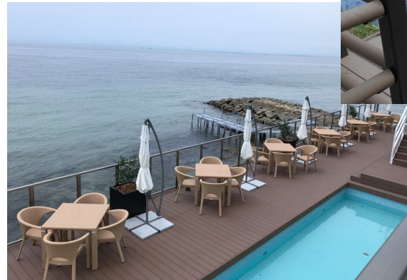
海辺 飲食店のテラス