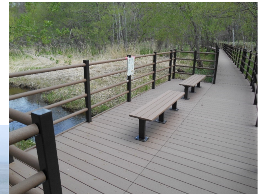
北海道 湿原の中の遊歩道